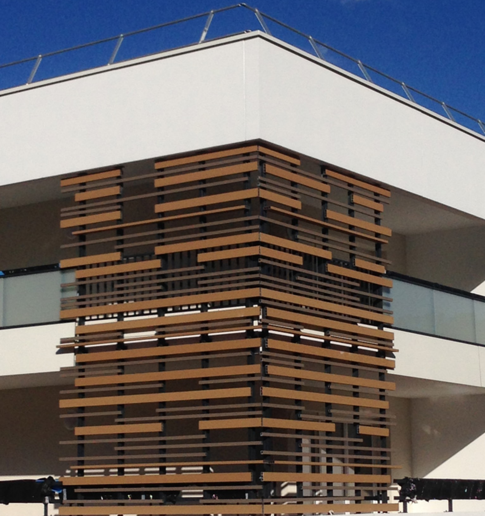
6009 & 6027 Habillage horizontal